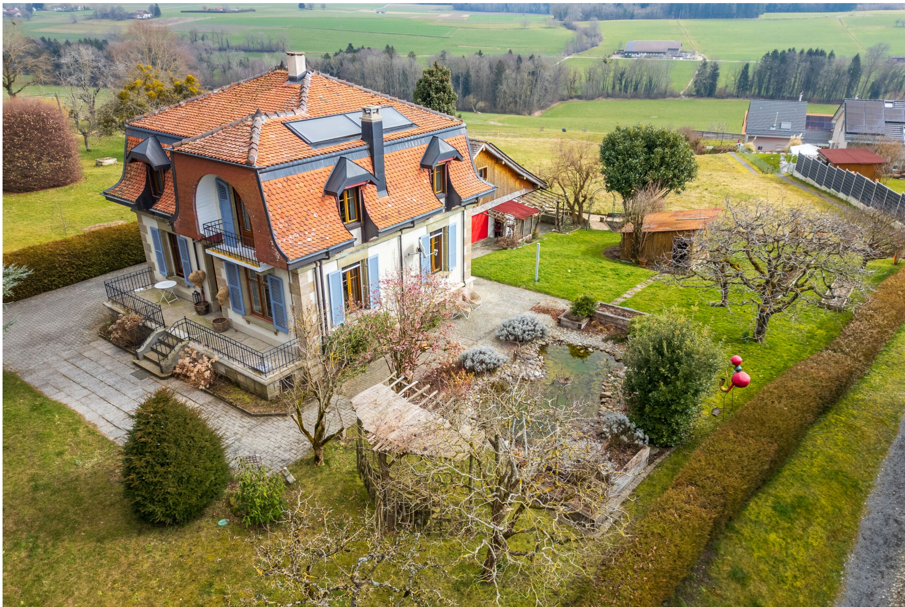
Vue aérienne sur la campagne