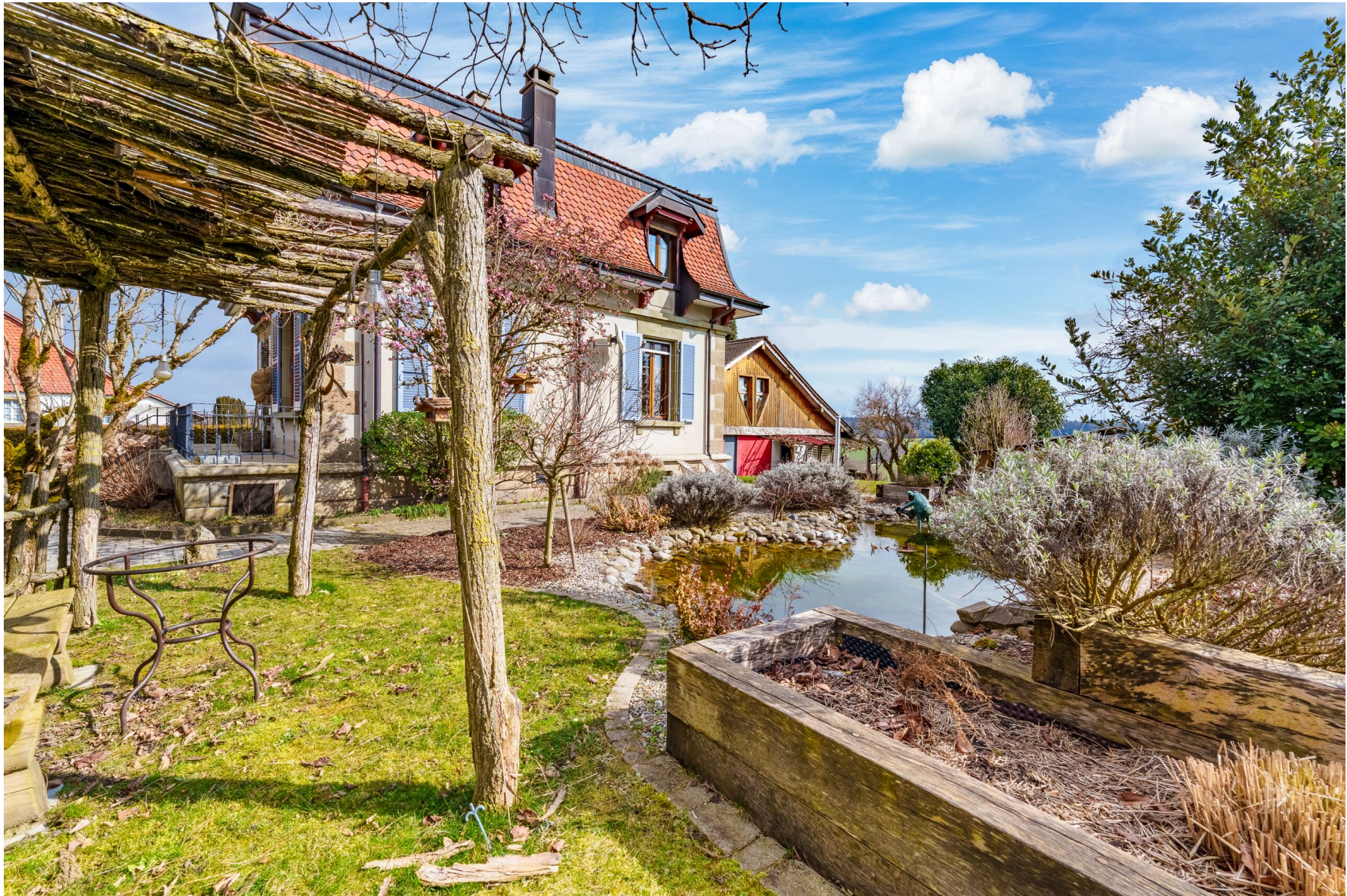
Étang de jardin et pergola