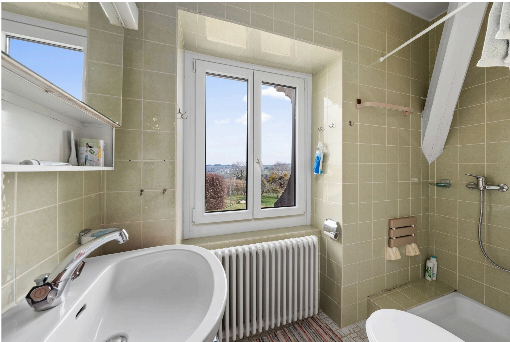
Salle de douche